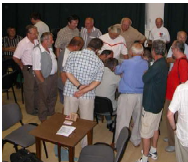
Kibicek hada drukkol a forduló minél gyorsabb befejezéséért