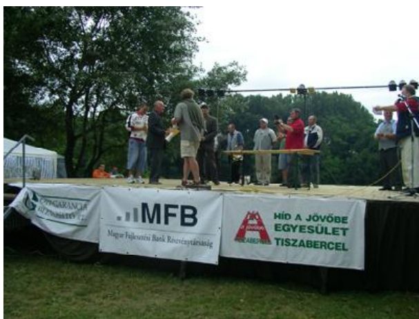
Eredményhirdetés. Színpadon a sárospatakiak (ha látható egyáltalán...)