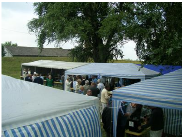
A helyszín (töltés mögött a Tisza)