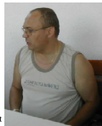
Stekli - 27 pont